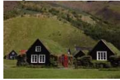
Torfhäuser in Skógar

Mit seinen zahlreichen geothermal beheizten Gewächshäusern ist das Städtchen Hveragerði das Zentrum des isländischen Gemüse- und Obstanbaus. Dort, wo anderswo die Stadtmitte ist, befindet sich in Hveragerði ein Geothermalgebiet mit einer kleinen Ausstellung.