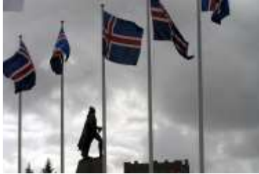
Reykjavík - Leifur Eriksson