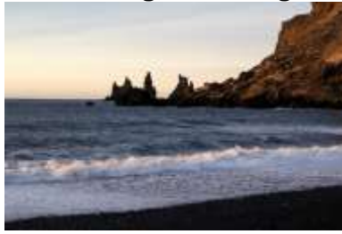
Lavastrand in Vík