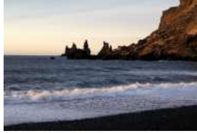
Lavastrand in Vík