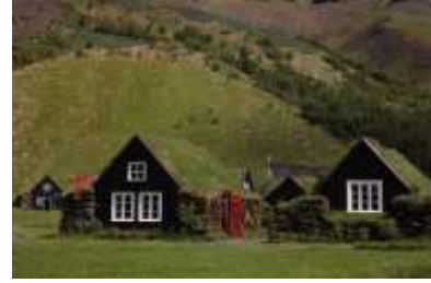
Torfhäuser in Skógar

Mit seinen zahlreichen geothermal beheizten Gewächshäusern ist das Städtchen Hveragerði das Zentrum des isländischen Gemüse- und Obstanbaus. Dort, wo anderswo die Stadtmitte ist, befindet sich in Hveragerði ein Geothermalgebiet mit einer kleinen Ausstellung.